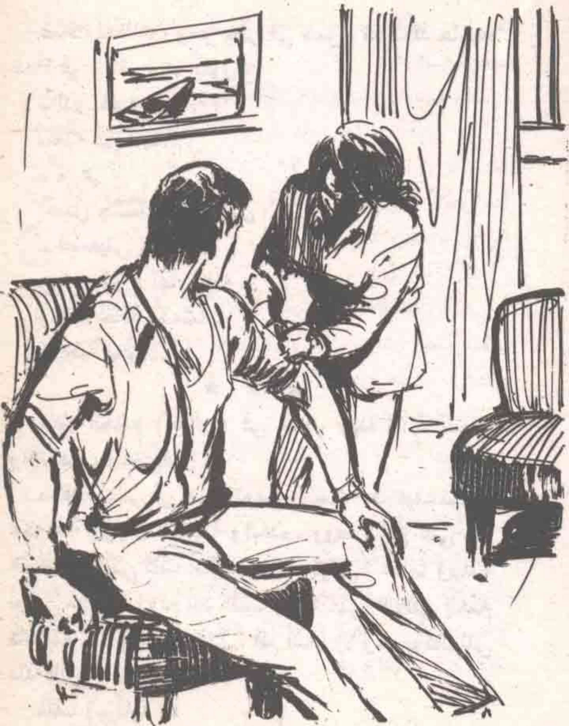
صعدا معا إلى المنزل ، وراحت هي تغسل الجرح وتضمّده في مهارة ..

- والآن دعنا نضمّد جرحك . صعدا معا إلى المنزل ، وراحت هي تغسل الجرح وتضمّده في مهارة ، وهي تقول :